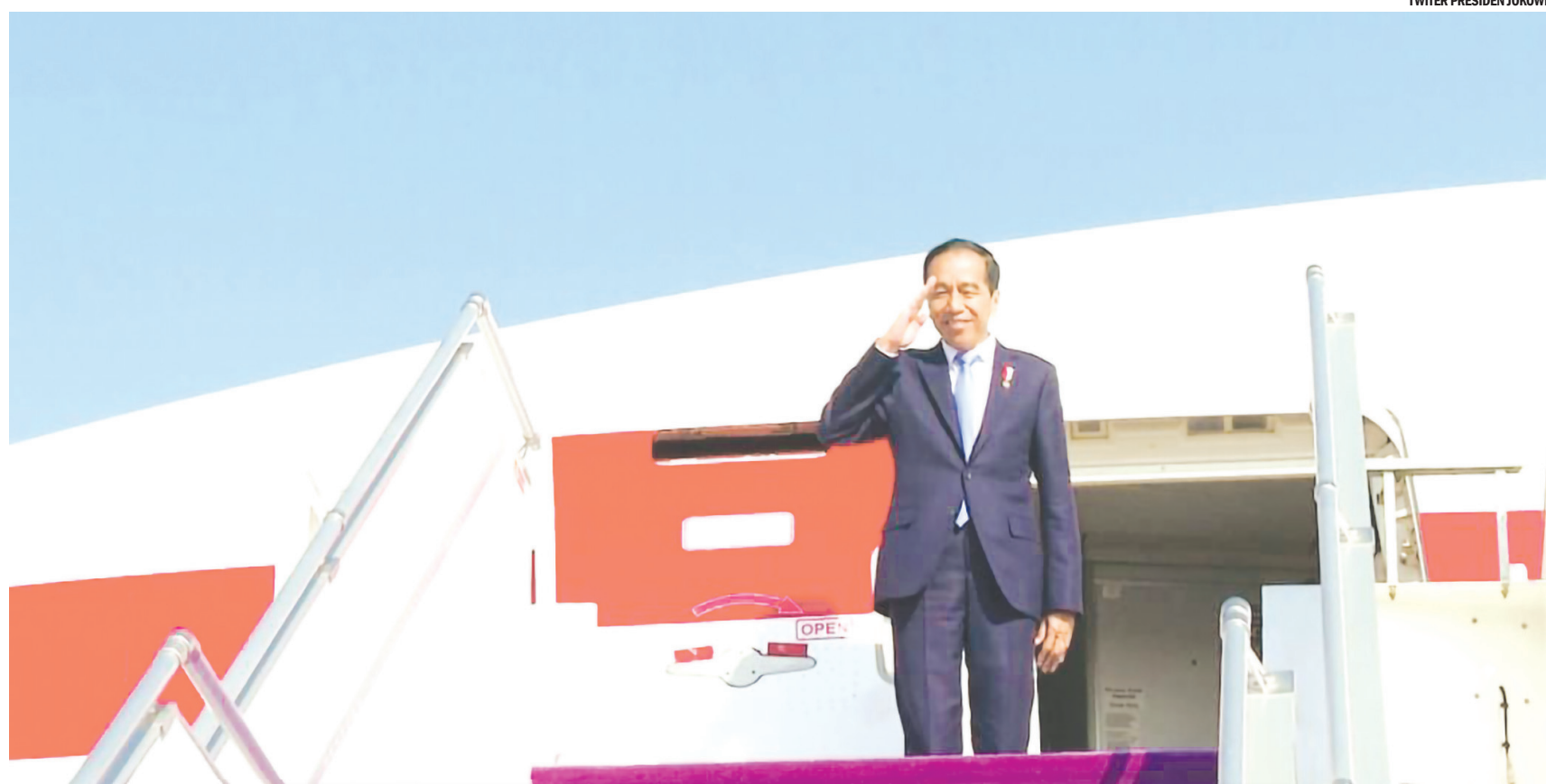
TWITER PRESIDEN JOKOWI

HARGA ECERAN DALAM KOTA RP2500, LUAR KOTA+ONGKOS KIRIM